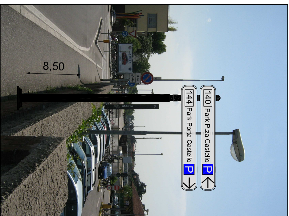
Vista del sito di posizionamento