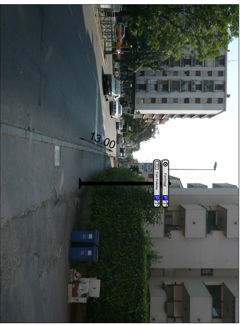
Vista del sito di posizionamento

Altre indicazioni: distanza dal semaforo mt. 13