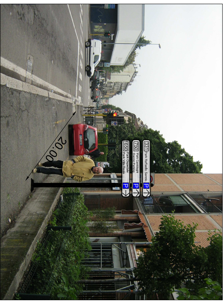
Vista del sito di posizionamento